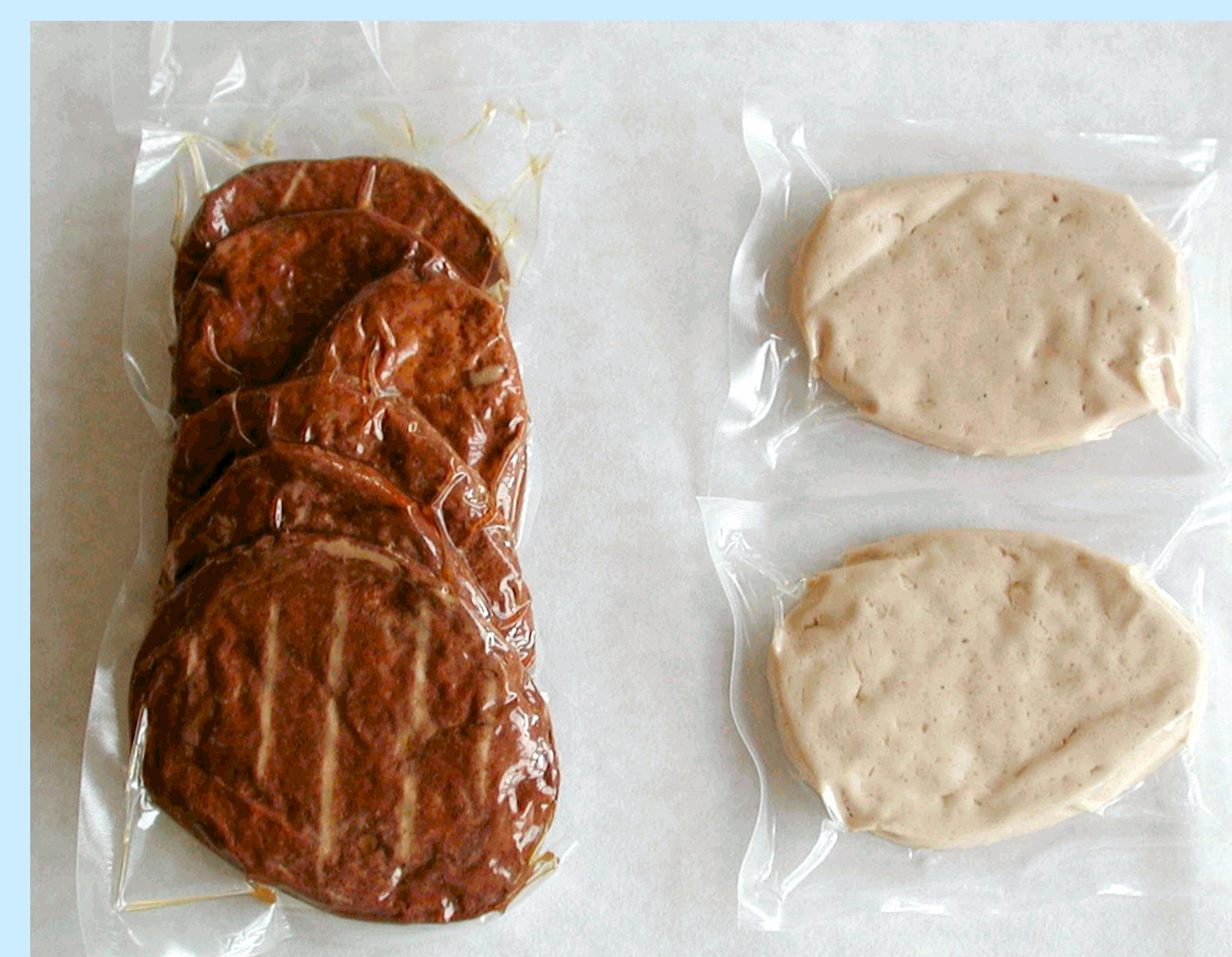
Obr. 2 Plátky marinované a přírodní

Zabalené a pasterované vzorky výrobků byly uloženy v chladničce při +4°C. Před uskladněním a po 6 a 12 týdnech skladování byla provedena mikrobiální analýza. Výsledky mikrobiálních analýz prokázaly jeho dlouhodobou skladovatelnost a řadí tento výrobek mezi bezpečné potraviny.